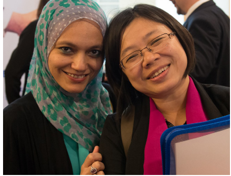
ITI Minsk, 2017

La paix et le développement sont interdépendants. (programme des Nations unies pour le développement)